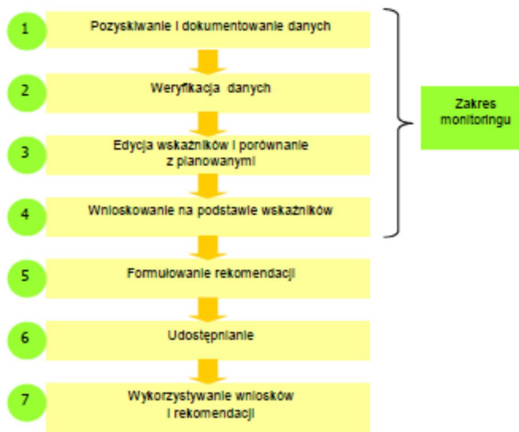
Rysunek 2. Proces oraz zakres monitoringu wdrażania elementów Strategii w Gminie Krzywca